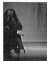
Piccoli, la La donna era vinta per me voluta a un ma per le percosse che la le aveva di so

non resto commosso: la peduca, si appostava a cassa sua, l'innocenza che le avrebbe lasciato la casa e che l'avrebbe sfregata con l'addio mazzetta di cui le intina le foto via